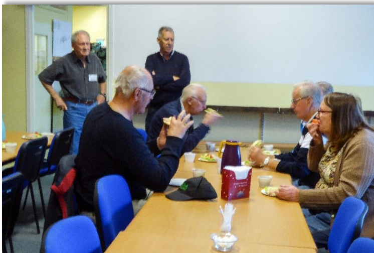
Fikasugna och intresserade av vad vi kan visa upp på Robotmuseet..