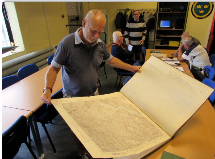
Rolf funderar på hur jag ska få rum med fältkartan i handskfacket på min Fiat.